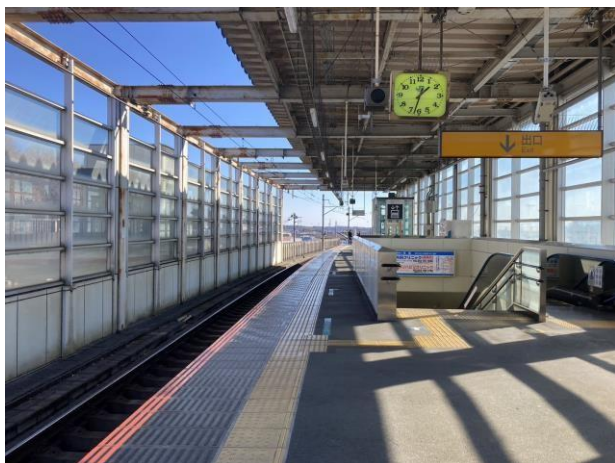
写真1 上溝駅のホーム

また、朝ラッシュ時間帯でも上下それぞれ毎時4本と本数が少ない。もし多摩線が上溝まで延伸すれば、多摩線は朝ラッシュ時間帯は毎時9本の運行になる予定だ。