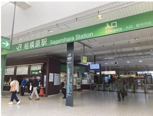
写真 3 相模原駅の 2 階(改札外)

また、相模原駅は快速も止まる主要駅で、朝ラッシュ時間帯は上り毎時 12 本、下り毎時 8 本の列車が発着している。多摩線が延伸すれば、上溝と同じく毎時 9 本の列車が発着する予定だ。