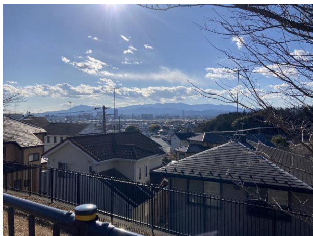
写真 8 見晴らしの丘付近から見た相模原駅方面

境川の手前で東京都に入り、小山郵便局や見晴らしの丘を通り、中間駅へ向かう。見晴らしの丘付近は標高が高くなっているが、 多摩線 はトンネルで地下を通る予定だ。