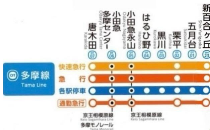
図1 小田急多摩線の路線図

途中駅には、退避・折り返し設備が無いので、途中駅での追い抜きや折り返しは行われていない(平日朝に6本だけある小田急多摩センター始発は、唐木田ー小田急多摩センターは回送で運転されている)。