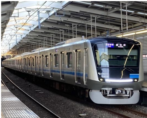
写真12 小田急多摩線