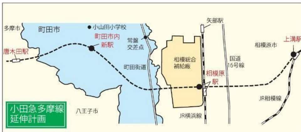
図 2 小田急多摩線の延伸計画