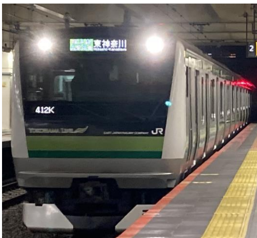
写真13 相模原駅で多摩線と接続する予定のJR横浜線