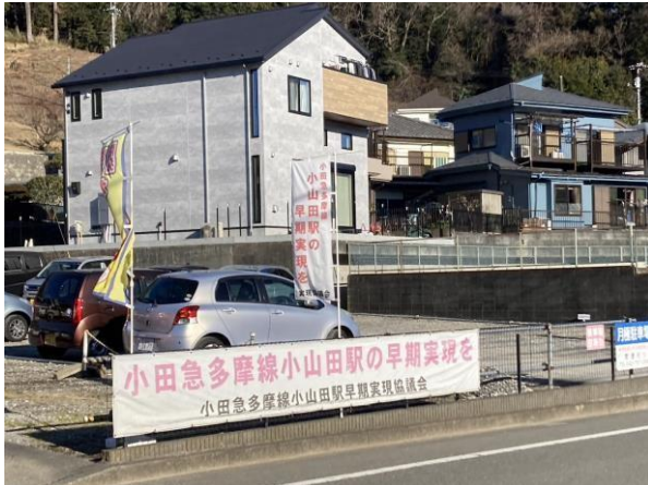
写真 10 中間駅の予定地付近にあった横断幕、のぼり

中間駅からさらに北へ進むと、喜多見検車区唐木田出張所がある。中間駅からここまでは高架やトンネルを繰り返す予定だ。