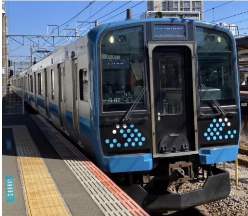
写真 14 上溝駅で多摩線と接続する予定の JR 相模線