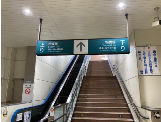
写真 2 上溝駅の 1 階(改札内) 上りと下りで同じホームが使われていることが分かる