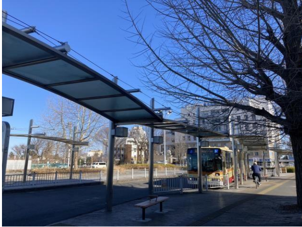
写真 5 相模原駅北口に停まっている神奈川中央交通のバス

まず相模原駅の北口を出る。相模原駅北口には、神奈川中央交通が通っていて(写真 5)、 多摩線 の新駅も北口に出来る予定だ(写真 6)。