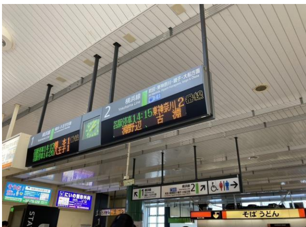
写真 4 相模原駅の 2 階(改札内) 上溝とは違い、上りと下りで違うホームが使われていることが分かる