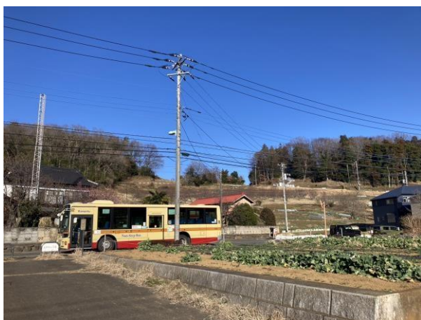
写真 9 中間駅の予定地 奥の方が標高が高くなっていて、予定地付近は標高が低いことが分かる

この中間駅付近は、今は新宿に出るためには、バスに乗り町田駅に出て、さらにそこから電車に乗る必要があるが、 多摩線 が延伸すれば 1 本で新宿に出ることが出来る。また、バスの本数は、朝ラッシュ時間帯でも毎時 3 本しか出ていないが、 多摩線 が延伸すると朝ラッシュ時間帯に毎時 6 本の列車が発着する予定だ。