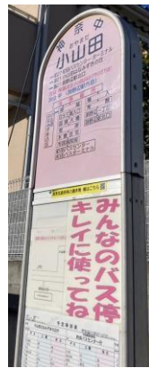
写真 15 現在、小山田周辺に唯一通っている公共交通機関の神奈中バス