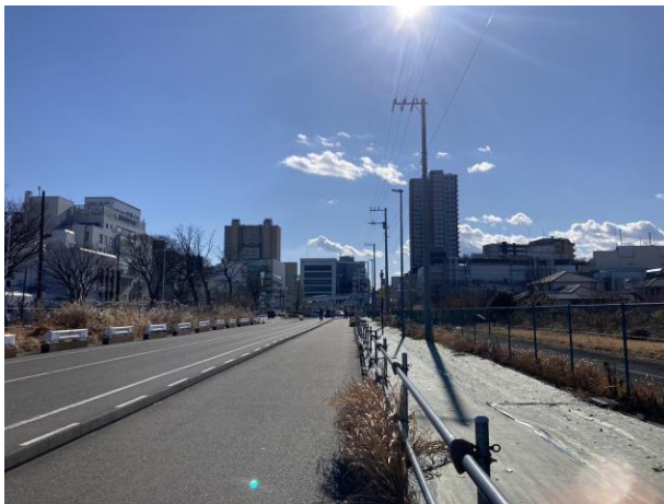
写真 6 この辺りの地下に多摩線の相模原駅が出来る予定

相模原駅北口から、南北道路を北に進んでいく。 多摩線 は、この南北道路の地下を通る予定だ。また、この南北道路の右側には相模総合補給廠という在日アメリカ陸軍の施設がある(写真 7)。