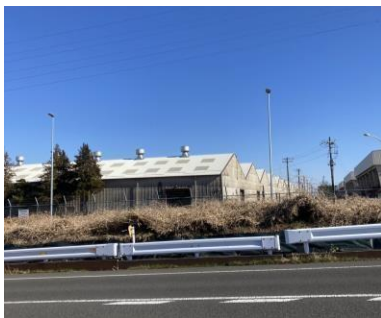
写真 7 相模総合補給廠

相模原駅北口から、南北道路を北に進んでいく。 多摩線 は、この南北道路の地下を通る予定だ。また、この南北道路の右側には相模総合補給廠という在日アメリカ陸軍の施設がある(写真 7)。